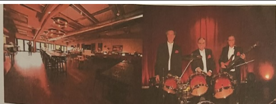
Restaurant « Chez Simone » Animation Aérodrome de Pontoise, 95 Boissy l'aillerie Trio « NUAGES »

DIMANCHE 11 FEVRIER 2024 (De 12H00 à 18H00)